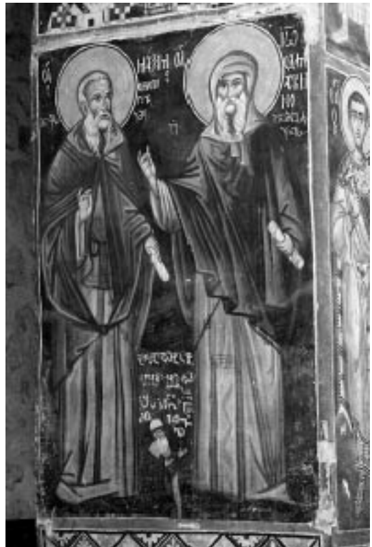
4. სამხრეთ-დასავლეთი ბურჯის აღმოსავლეთი წახნაგის მოხატულობა. XVI ს.

II. სამხრეთ-დასავლეთი ბურჯის დასავლეთი და აღმოსავლეთი წახნაგების მოხატულობა (ასევე ამჟამად სამხრეთ კედელზე ჩამოკი-