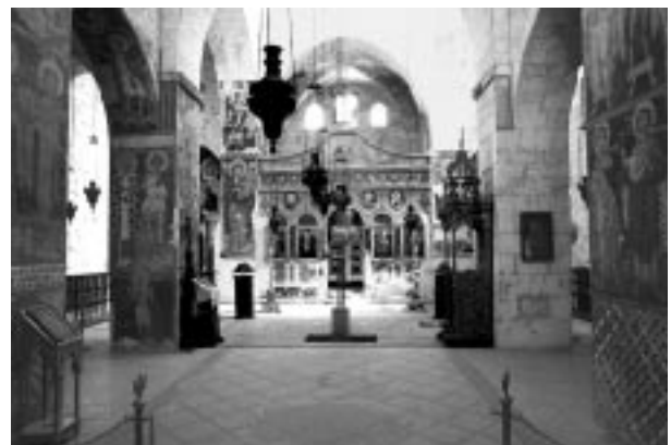
1. ჯვრის მონასტრის ტაძრის ინტერიერი. ხედი აღმოსავლეთისაკენ

ექსპედიციის შედეგად გამოიკვეთა შემდგომი კვლევის კონკრეტული მიმართულებები და პრობლემატიკა, რაც ფილოლოგიების, ისტორიკოსების, პალეოგრაფების, მხატვრობისა და არქიტექტურის ისტორიკოსების ერთობლივ მუშაობას გულისხმობს. ქართველ ხელოვნების ისტორიკოსთა მიერ მოხდა მხატვრობის მიზანმიმართული დათვალიერება-აღწერა,