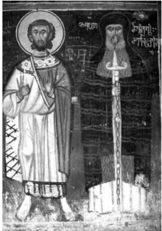
8. სამხრეთ-დასავლეთი ბურჯის სამხრეთ წახნაგის მოხატულობა. VII ს.

ნახევარფიგურებით. სადიაკვნეს თაღში გამოსახული იყო "მოგვთა თაყვანისცემა" (ამჟამად აღარ არსებობს).