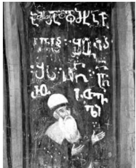
12. შოთა რუსთაველის პორტრეტი.

დღეისათვის დადგენილია პრობლემების წრე, წამოყენებულია რამდენიმე ჰიპოთეზა, რაც მთავარია, გაკეთებულია საფუძვლიანი აღწერა, გრაფიკული და ფოტო-ფიქსაცია. ყოველივე ეს ქმნის საფუძველს სათანადო სახელოვნებათმცოდნეო კვლევისათვის, რომელიც, იმედი გვაქვს, უფრო სრულ წარმოდგენას შეგვიქმნის წმინდა მიწაზე ქართველთა მოღვაწეობის ამ უმნიშვნელოვანესი ძეგლის შესახებ.