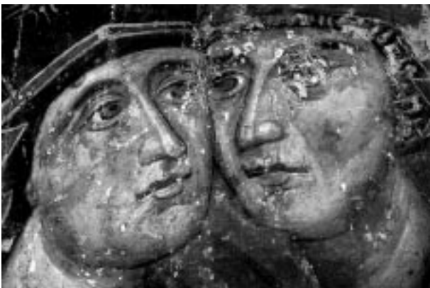
7. მარიამისა და ელისაბედის შეხვედრა. XIV ს.

ჩრდილოეთი საბჯენი თაღის დასავლეთის კალთაზე წარმოდგენილია წინასწარმეტყველი სოფონია (XVII ს.). დასავლეთი საბჯენი თაღის სოფიტში - მედალიონების რიგი წმინდანთა