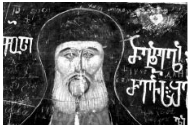
6. თეოდოსე მანგლელი რევიშვილი. XVII ს.

საკურთხეველის აფსიდში მოხატულობა არ შემორჩა, თუმცა მის ზედა ნაწილში გაჭრილი სამი სარკმლის თავზე და მათ შორის გაიჩნევა ფრონტალურად მდგომ ფიგურათა მკრთალი "ანრდილები", რომელთა იდენტიფიცირება შესაძლოა მოხერხდეს ხარაჩოებიდან ძლიერი განათებით დათვალიერებისას.