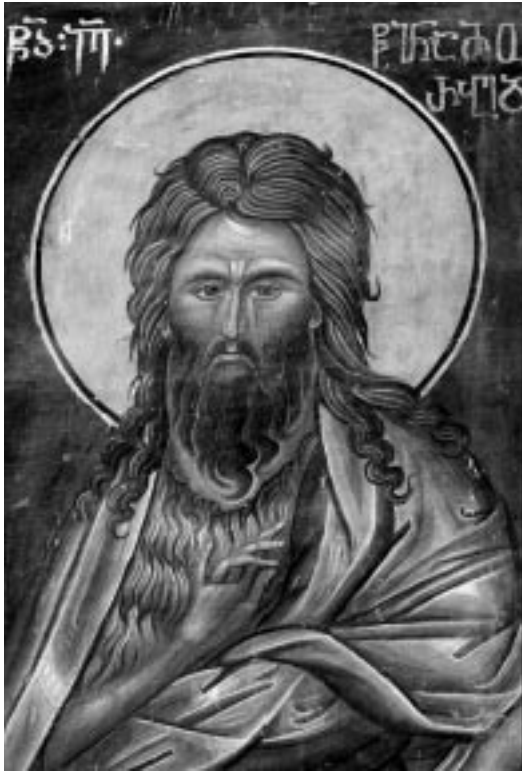
5. წმ. იოანე ნათლისმცემელი. XIV ს.

დებული ფრაგმენტი) შოთა რუსთაველისა და სხვა ვოტივური გამოსახულებებითურთ (სავარაუდოდ XVI საუკუნისა);