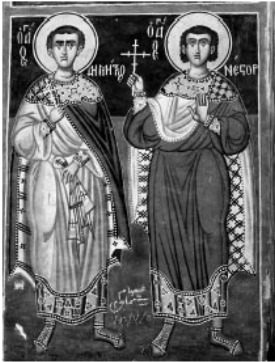
11. სამხრეთ-დასავლეთი ბურჯის ჩრდილოეთ წახნაგის მოხატულობა. XVII ს.

ნიშანდობლივია, რომ ქართული წარწერები მრავალგზის იყო დაფარული საღებავით და შენაცვლებული ბერძნული წარწერებით. მაგ., 1901 წლის ფოტოზე "მთავარანგელოზთა კრების" კომპოზიციაზე არის ქართული წარწერები, 1960 წლის ფოტოებზე აქ ბერძნული წარწერებია, ხოლო გაწმენდის მერე კვლავ ქართული წარწერა გამოჩნდა, ისევე, როგორც "უძილი თვალის" გამოსახულებაზე. ბევრ ადგილას (მაგ., წმ. ლუკასა და წმ. პროხორეს ფიგურებთან) ამჟამად არსებული ბერძნული წარწერების ქვეშ ნათლად გამოსჩვივის ქართული ასოების მოხაზულობანი. ცნობილია, რომ XX ს-ის 80-იანი წლების ბოლოს ბერძნული საპატრიარქოს დაკვეთით ფრესკები "რესტავრირებულ" იქნა, უფრო სწორად, მათ "დასრულებული" სახე მიეცათ, რითიც ორიგინალური მხატვრობის ბევრი ნიშანი წაიშალა.