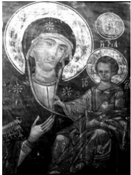
10. ღვთისმშობელი ოდიგიტრია. XIV ს.

ფერწერულმა ანსამბლმა XX ს-ის განმავლობაშიც საგრძნობი ცვლილებები განიცადა.