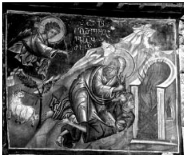
3. სამხრეთ-დასავლეთი ბურჯის აღმოსავლეთი წახნაგის მოხატულობა. XVI ს.

მხატვრობის დაკვირვებით შესწავლამ დაგვარწმუნა, რომ ამ ორი ქრონოლოგიური ფენისაგან ბევრი ნიშნით სხვაობს სამხრეთ-დასავლეთი ბურჯის მხატვრობა, ანუ მოხატულობის ის ნაწილი, სადაც შოთა რუსთაველისა და სხვა, დღემდე შემორჩენილი ვოტივური გამოსახულებებია მოთავსებული და სამხრეთ-აღმოსავლეთი ბურჯის ამჟამად ჩამოსხნილი ფრაგმენტი, რომელიც ახლა სამხრეთის კედელზე კიდია.