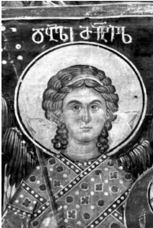
9. წმ. მიქაელ მთავარანგელოზი. XIV ს.

დასავლეთ კედლის სამხრეთ პილასტრზე გამოსახული არიან ექვთიმე და გიორგი მთაწმიდელები (XVII ს.).